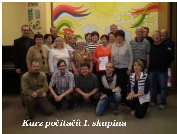
Kurz počítačů I. skupina