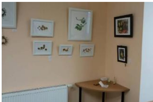
Po výmalbě – výstava obrázků