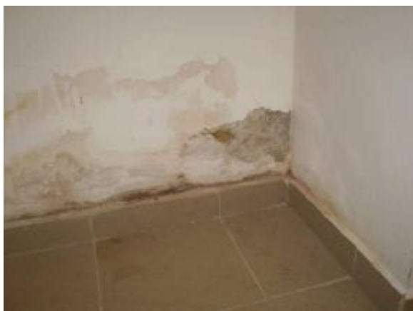
Před výmalbou – znehodnoceno i plísní